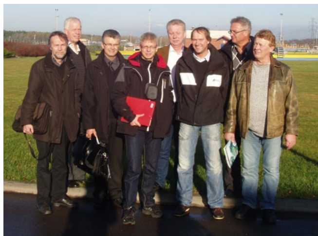
Bild: Några av deltagarna på resan till Polen